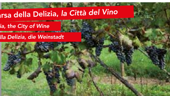
Casarsa della Delizia, die Weinstadt