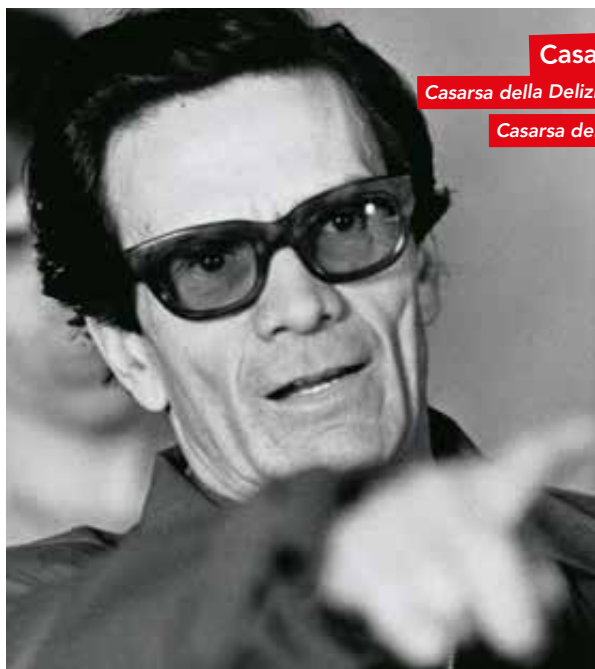
Casarsa della Delizia, la Città del Vino