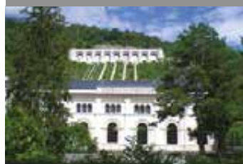
nelle vicinanze in the area in der Umgebung

L'Ex Centrale Idroelettrica di Malnisio. Costruita nel 1905, grazie ad essa si accese a Venezia l'illuminazione pubblica. Operativa fino al 1988, dal 2006 è Museo della Centrale e Immaginario Scientifico, un museo della scienza interattivo e multimediale.